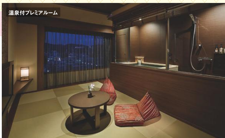
温泉付プレミアムルーム