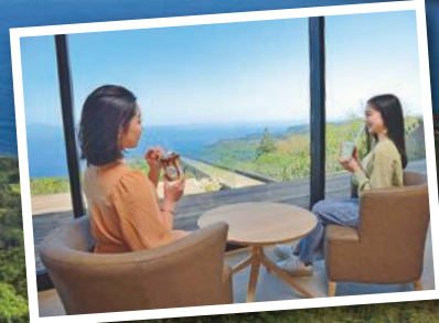
小室山 (ホテルより車で約15分)